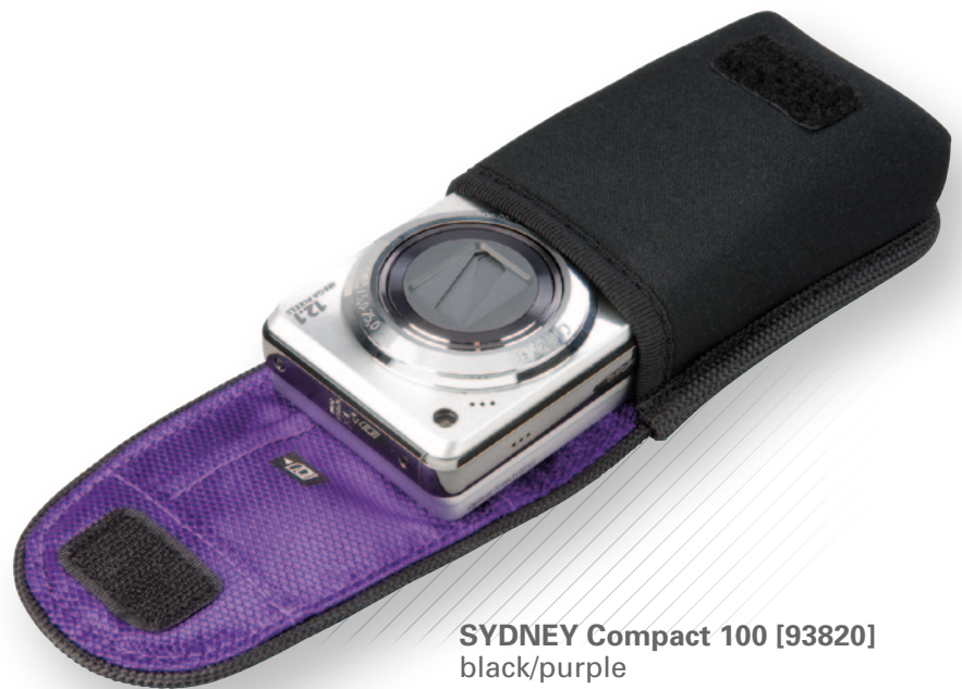
SYDNEY Compact 100 [93820] black/purple