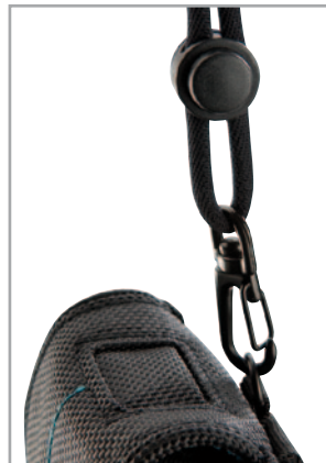
Moderne, verstellbare Halskordel Modern, adjustable neck band