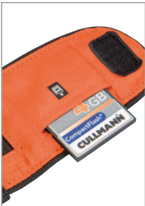
Innentasche für Speicherkarten, etc. Inner pocket for memory card, etc.