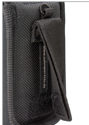
Q+S System (Quick+Save), Doppel- Gürtelschleife mit zwei Befesti- gungsmöglichkeiten Q+S System (Quick+Safe), double belt loop with two fastening possi- bilities