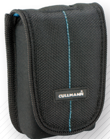
SYDNEY Compact 100 black/blue

Alle Maße und Gewichtsangaben sind Circa-Werte. Design-Änderungen und Farbabweichungen zu den Abbildungen sind möglich. Technische Änderungen sowie Irrtum vorbehalten.